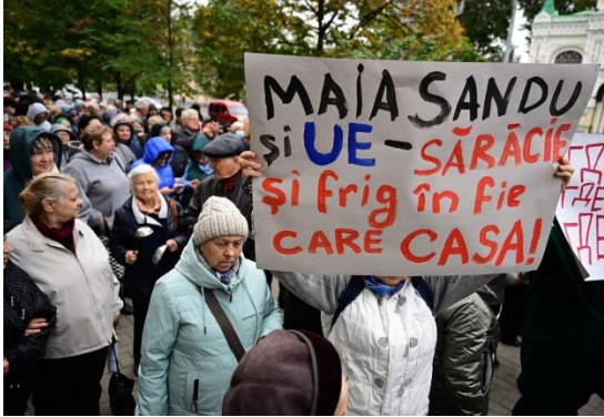
Fig. 1 A protest in the Republic of Moldova