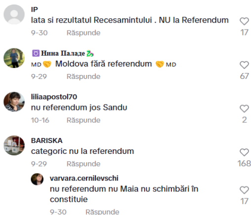
Fig 2. Comments from a propagandistic video on TikTok

remaining in the country voted NO. The final results were very closely, with 50.08% for YES and 49.93% for NO.