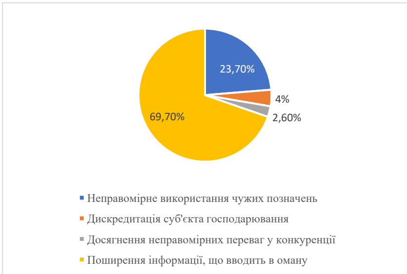
Рис. 2. Структура порушень у сфері недобросовісної конкуренції в Україні (2025 рік)

З метою оцінки поширеності зазначених форм варто звернутися до аналітичних даних Антимонопольного комітету України. У звітах Комітету за 2025 рік наведено структуру порушень у сфері недобросовісної конкуренції, що дозволяє визначити, які саме форми є найбільш розповсюдженими на практиці [3].