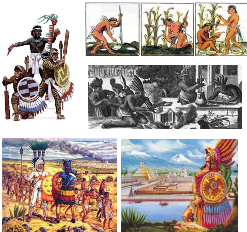
Рис. 1. Образ чоловіка у культурі ацтеків

В декоративно-прикладному мистецтві Мексики та її архітектурі панують яскраві орнаменти, сповнені образів богів, тварин, рослин, мотивів з життя та історії цієї різноманітної країни. Усі ці елементи можна модернізувати та використати для створення ювелірних прикрас, оскільки вони мають велике, як естетичне, так і смислове значення. Це можна пояснити тим, що сучасна мексиканська культура була сформована злиттям особливостей цілого ряду цивілізацій: індіанців, ацтеків, майя й багатьох інших племен, що проживали на території сучасної Мексики, а згодом ще й колонізаторів-іспанців. Саме через це мексиканські традиції дизайну мають велику цінність для світу, бо вони не є уособленням якоїсь однієї культури. Мексиканський стиль – це, в першу чергу, неймовірний синтез, що можна проєціювати на майже будь-яку галузь людського життя в усьому світі [6, 7]. Після вивчення та аналізу інформації про культуру ацтеків, особливостей їх архітектури,