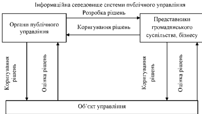
Рис. 2. Комунікаційних процес у системі публічного управління

У сучасних умовах впровадження інформаційно-комунікаційних технологій представляється можливим використання нових інструментів підвищення гласності, відкритості, прозорості системи публічного управління, що сприяють активному залученню громадянського суспільства і бізнес-структур до процесу публічного управління не тільки з метою здійснення функції контролю щодо діяльності органів державної влади, а й використання інтелектуального потенціалу населення з метою вирішення соціально значущих проблем.