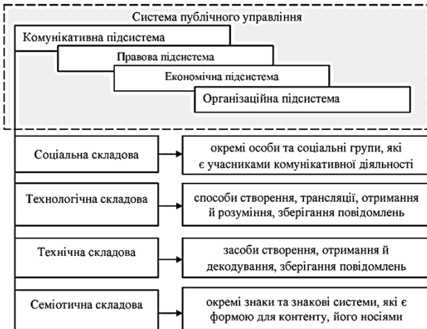
Рис. 1. Складники комунікативної підсистеми публічного управління

Із позицій структурно-функціонального розгляду комунікативної підсистеми публічного управління та комунікативної діяльності в публічному управлінні можемо виділити чотири притаманні їм основні складові (підсистеми) 24 (рис. 1).